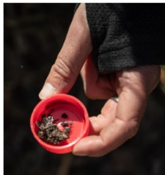
Wat ottermest voor de opleiding.

Een voorkeursras is er niet. Bij de geselecteerden zaten een labrador, een basset en een springer spaniel. 'De baasjes die