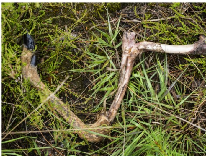
Hier is een wolf gepasseerd, getuigt een afgekloven bot.

omdat ze bijdragen aan wetenschappelijk onderzoek.